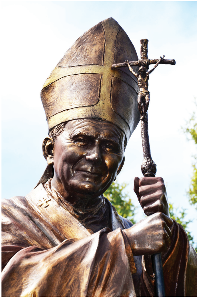
Statue de Saint Jean Paul II au Sanctuaire de l'Ecce Homo. Ce pape canonisa Sainte Marie Faustine à Rome le 30 avril 2000

cuisinière, boulangère, jardinière et tourière.